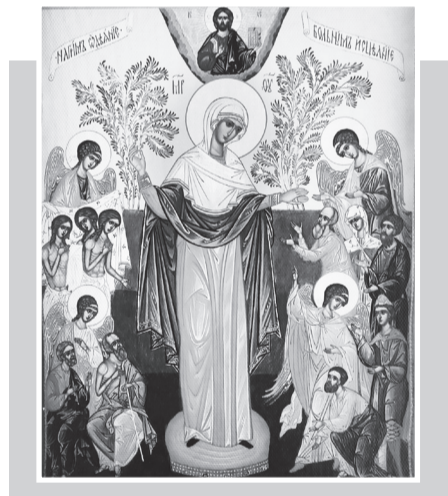
6 ноября — иконы Божией Матери «Всех скорбящих радость»