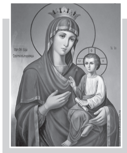
22 ноября — иконы Божией Матери «Скоропослушница»

Во время похода святого князя Дмитрия Донского на Куликово сражение в 15 верстах от Москвы в ветвях деревьев ему неожиданно явилась икона святителя Николая Чудотворца. Князь воспринял это чудо как знак Божьего благословения. Он воскликнул: «Сия вся угреша (согрело) сердце моё!» и дал обет в случае победы основать на этом месте обитель. Так появился Угрешский монастырь (прозванный также Николо-Угрешским) с соборным храмом в честь святителя Николая, в котором впоследствии явилась чудотворная икона Божией Матери, получившая название «Взыграние». На протяжении многих лет она была одним из символов обители. После революции монастырь разорили, икона исчезла. Но до наших дней сохранился её список, датированный 1814 годом, который сегодня входит в собрание Московского государственного объединённого музея-заповедника. В 90 годах XX века с него были сделаны несколько списков; один передан Николо-Угрешскому монастырю и ныне находится в музее-ризнице обители. В монастыре есть ещё один чтимый образ Божией Матери «Взыграние». Он отличается стилистически от Угрешского, но относится к тому же иконографическому типу. В начале XXI века его передала обители группа верующих, пожелавших остаться неизвестными. С Крестным ходом братия и прихожане монастыря встретили икону у Святых врат и внесли в Спасо-Преображенский собор, где она пребывает по сей день.