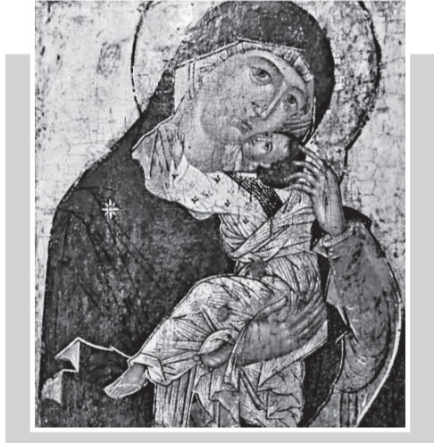
20 ноября — иконы Божией Матери «Взыграние»

В самом названии образа — вера в Богоматерь как дивную Заступницу, утешающую скорбящих и страждущих, утирающую слёзы плачущих, в горе дарующую минуты отрады и радости небесной. На этой иконе Богоматерь пишут во весь рост; или во славе — с короной на голове и в царском одеянии, или в обычном одеянии земных Её дней с белым платом на голове. Иногда с Младенцем на руках — как на московском первообразе, иногда без Младенца — как на прославившейся в Петербурге иконе с монетами. Богородица окружена бедствующими людьми: нагими, обидимыми, алчущими. Рядом часто изображают ангелов, посланных Владычицей для утешения страдания людского. Ангелы, приникая к людям, указывают им на Богоматерь. Одна из икон «Всех скорбящих радость» прославилась как чудотворная в XVII веке в Москве. Первое чудо от неё совершилось в 1688 году над больной Евфимией, сестрой Патриарха Иоакима, исцелившейся от смертельной раны в боку после водосвятного молебна пред этим образом. Есть мнение, что первоначальный образ Богоматери «Всех скорбящих Радость» перевезён был в Петербург царевной Наталией Алексеевной, — и это именно та икона, которая находится в Скорбященской церкви на Шпалерной. Но более утверждено мнение, что первообраз остался в Москве.