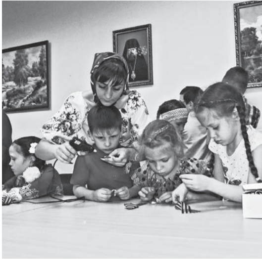
Приближающийся День Победы определил 6 мая тематику занятия в детской воскресной школе «Радость моя».